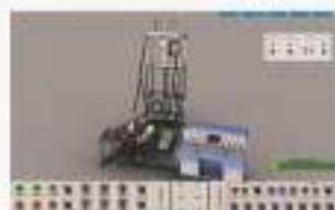
THS-ATS-1 矿井提升机仿真软件