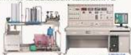
THPD-1型 电力自动化仪表实训平台