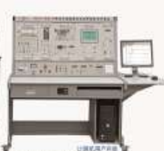
THPPSM-1型 PLC·步进·伺服控制综合实训平台