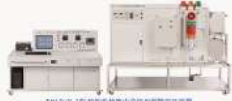
THLDJK-1型 船舶机舱集中监视与报警实训装置