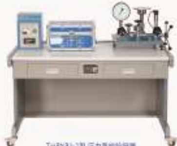
THPYR3-1型 压力量热实验装置