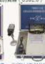
THRDV-1型 DM6446达芬奇视频应用实验/开发平台