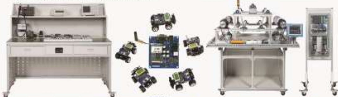
THEOS-1型开源电子产品设计开发创新平台

1728.THPSW-3型 轴角伺服与调速综合实验系统 1729.THEGM-1型 GPS/GSM移动车辆监控管理实验系统 1730.THECG-1型 现代电子与通信技术综合创新实验装置 1731.THIZK-1型 网络型张力控制系统实验平台 1732.THEHA-1型 嵌入式智能家居应用综合实验开发系统 1733.THEZK-1型 智能控制技术开环综合实验系统 1734.THETY-1型 太阳能转换与电子控制实验装置