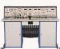
THETEC-1型 电工·电子技术创新设计综合应用实训装置