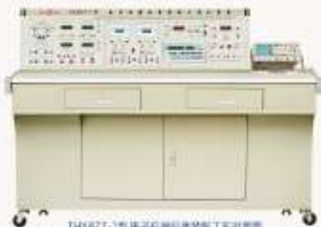
THYBZT-1型 电子仪器仪表装配工实训装置