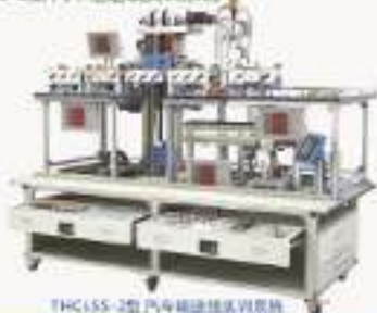
THCLSS-2型 汽车涂装实训系统