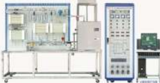
THLKRS-1型 热水供暖循环系统综合实训装置