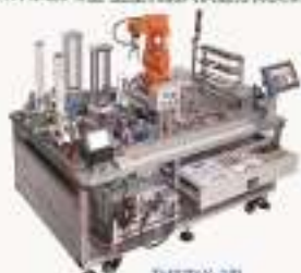
THRBYV-2型 机器人柔性应用教学平台（ABB）