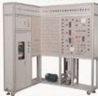
THJDEC-2型 电梯电气连接与调试实训考核装置