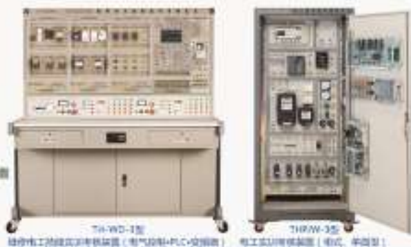
THWD-1型 维修电工技能实训考核装置 (电气控制+PLC+变频器) THPW-3型 电工实训考核装置 (柜式、单面型)