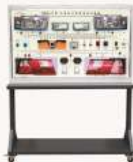
THCESEJ-13型 汽车启动系统示教板