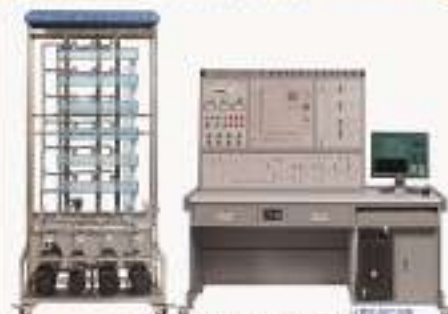
THPV1-2型 变频恒压供水系统实验装置