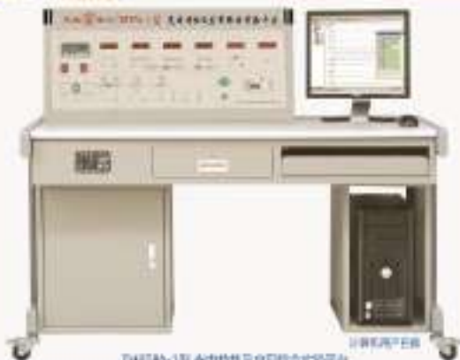
THPTA-1型 光电特性及光电综合实验平台