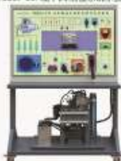
THCESEJ-12型 汽车灯光照明系统示教板