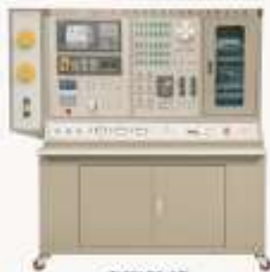
THWLD5-1型 数控机床电气控制与维修实训台 (西门子)