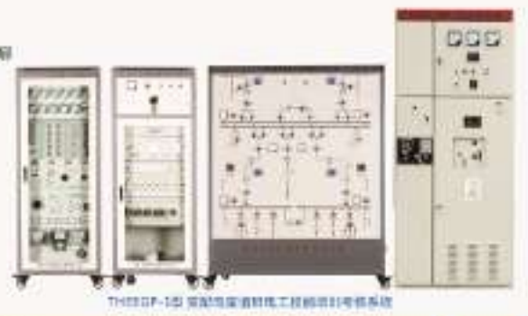
THPTSD-1型 变电站值班员实训考核系统