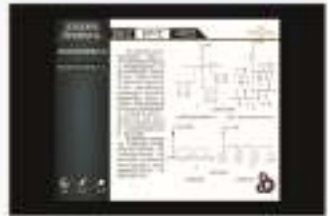
THS-EGP-1 供电系统的仿真软件