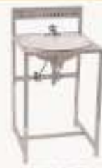
THPXBQ-1型 小便器安装实训装置