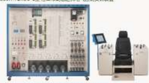
THGKMJ-1型 港口门机电气控制实训装置