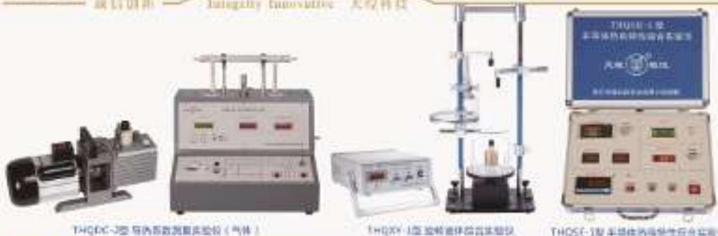
THQDC-2型 导热系数测量实验仪(气体) THQXY-1型 旋转摆杆导电实验仪 THQSC-1型 半导体导电系数综合实验仪