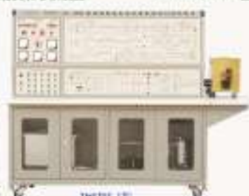
THKPS-1型 高电压中频电击技能实训考核装置