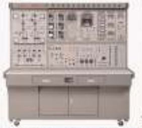
THRETP-1型 牵引供电系统继电保护实训装置