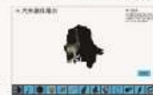
THS-CZX-1 汽车整车电气系统3D仿真软件