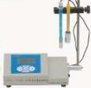
THAID-1型 激光粉尘测定仪