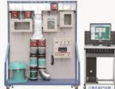
THSAPY-1型 通风排烟系统考核培训装置