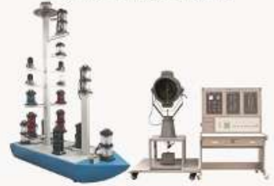
THLDLJ-1型 船舶主机监控系统实训平台