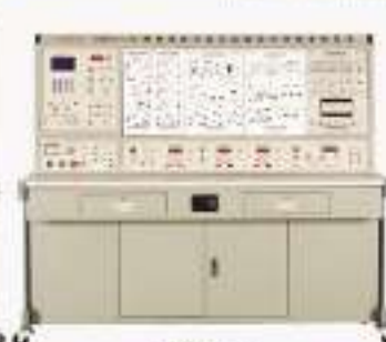
THW-PD-2型 网络型变频调速电机实训考核装置