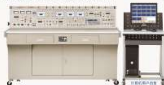
THHE-1型高性能电工技术实验台(联网型)