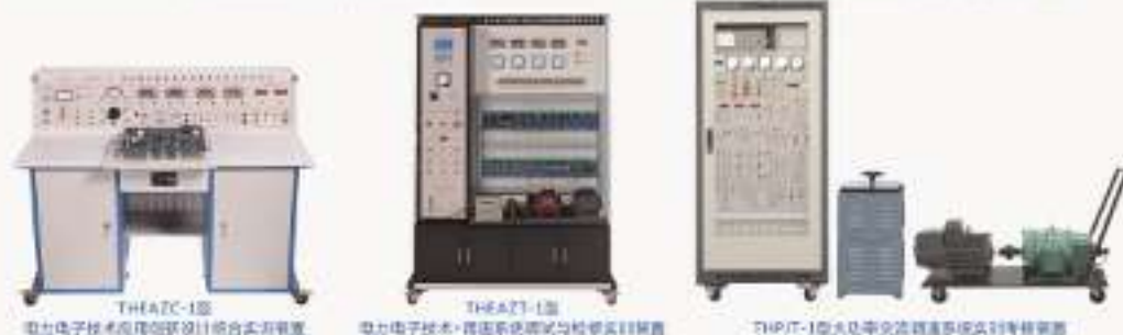
THEAZC-1型电力电子技术应用创新设计综合实训装置 THEAZT-1型电力电子技术+调速系统调试与检修实训装置 THPT-1型大功率交流调速系统实训考核装置