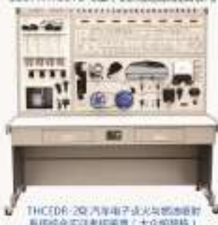
THCEDR-20 汽车电子点火与燃油喷射系统综合实训考核装置 (大众帕萨特)