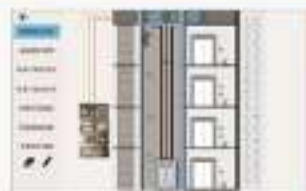
THS-JVL-1 装配生产线虚拟车间仿真软件