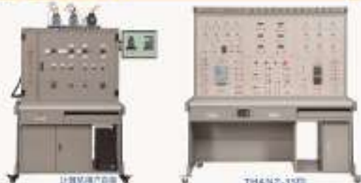
THS-X62W型 机床电气控制线路实训考核装置 THANZ-35型 交直流传动系统实训考核装置