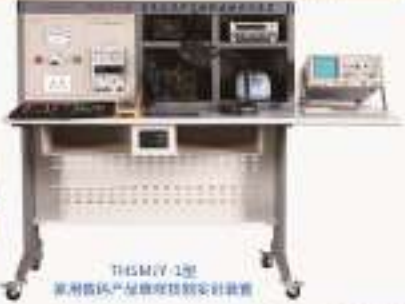
THSMY-1型 家用数码相机维修技能实训装置