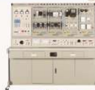
THW-WD-A型 网络型变频调速电机实训考核装置