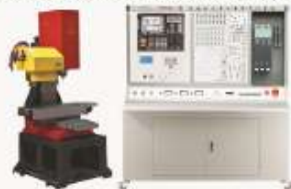
THWHRD-1型 数控加工中心维修实训系统 (西门子) (配实物小加工中心)