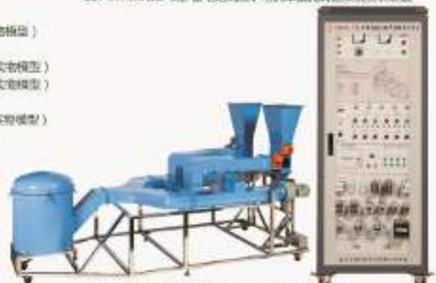
THMAFE-1型 矿井通风机电气控制实训装置（配实物模型）