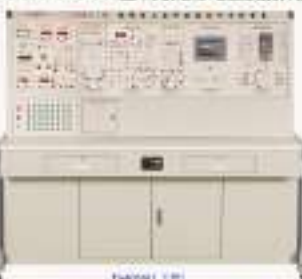
THPWJ-1型 维修电工技师技能实训考核装置