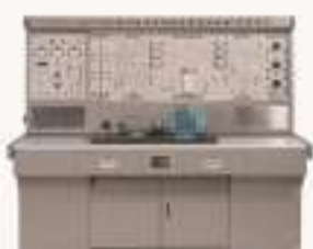
THEAZT-35B 电力电子与调速系统实验/开发平台