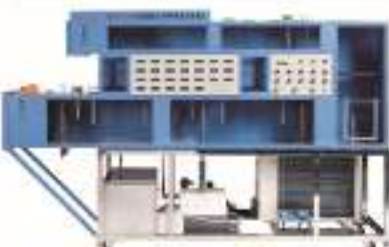
THPKTZ-1型 中央空调全空气调节系统实验装置