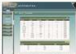
THS-LSC-1 物流供应链协作系统软件