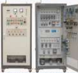
THW-AC-1型 网络型变频调速电机实训考核装置 ( 两版双机型, 四合一型, 四网机, ZigBee无线网 )