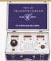
THICB-1型 X线机模拟机联于电脑实验箱