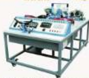
THCDS-7W型 汽车发动机总成系统实训考核装置 (大众朗逸50T)