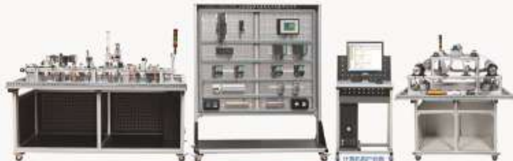
THNA-1A/1B型 工业网络集成控制技术实验/开发平台