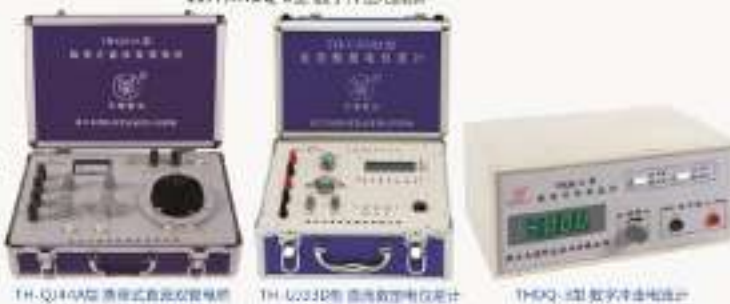
TH-Q144A型 便携式直流双臂电桥 TH-U33D型 直流数字电压表计 THQD-3型 数字冲激电压计