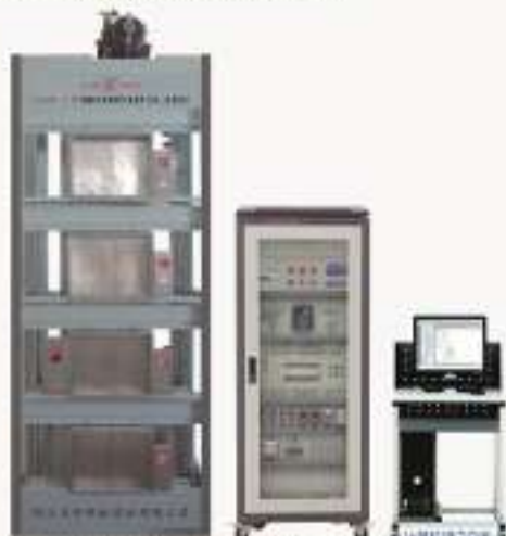
THWDT-1型 多轴串并联实物教学实验装置 (六轴)