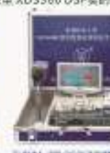
THRIM-2型 DSP6000数字图像处理实验/开发平台