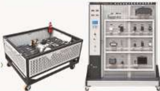
THNEDD-1型 汽车电动力系统实训考核装置