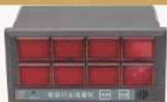
THICFW-1型智能闪光报警仪

1678.THIC-W000/W100系列 无线记录仪 1679.THICM1-1/2型 智能多点巡回仪 1680.THICFW-1型 智能闪光报警仪 1681.THICAM-1型 智能数字交流功率表 1682.THICDP-1型 智能数字直流功率表 1683.THICSM-1型 智能转速测试仪