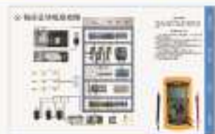
THS-WSM-1 数控铣床维修仿真软件