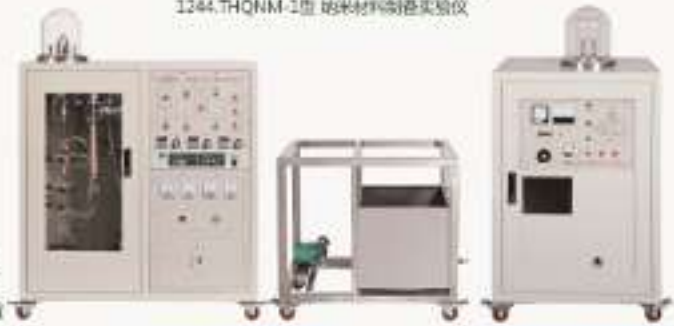
THCLZK-1型多功能真空实验仪 THQNM-1型纳米材料制备实验仪