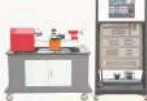
THWLZT-1A/1B/1C型 数控机床装调维修实训系统 (配实物小机床)