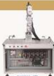
THRBC1-1型 六自由度直驱并联机器人培训系统（桌面型）