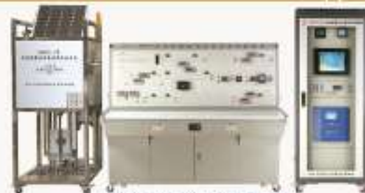
THRPTY-1型 太阳能光伏发电电源系统实验系统