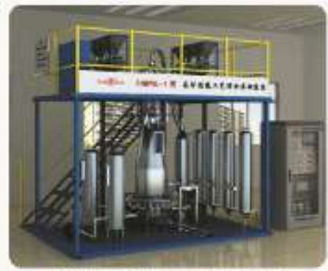
THM1PL-1型炼钢工艺综合实训装置 (工程型)