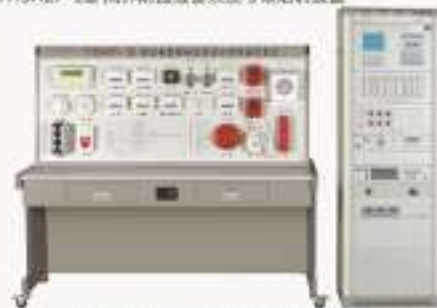
THSAXF-1型 消防报警联动系统考核培训装置