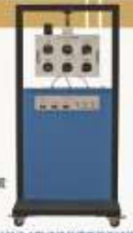
THAEYS-1型 飞机仪表系统实训装置