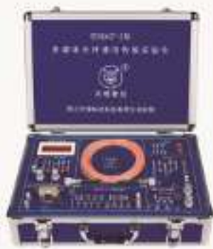
THQGT-2型 激光衍射与扫描物镜实验仪