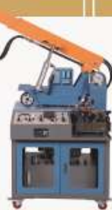
THHEZY-1型 注塑机液压系统实训装置