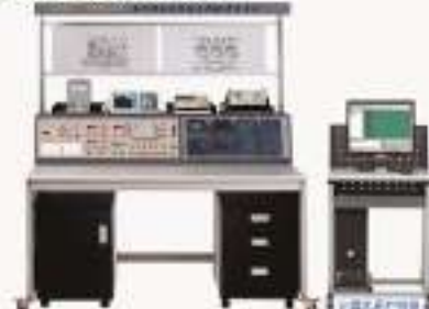
THETDA-4型电子综合应用技术实验/开发平台