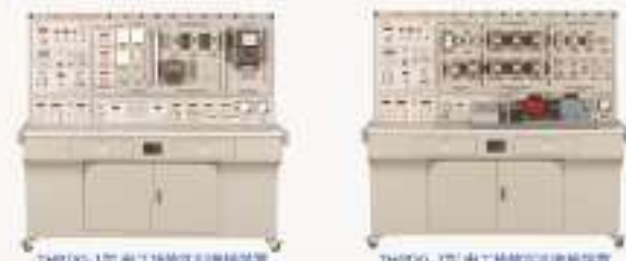
THPDG-1型 电工技能实训考核装置 THPDG-2型 电工技能实训考核装置