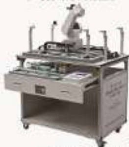
THPPSF-1A/1B型 可编程控制系统设计综合实训装置