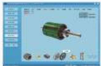
THS-ECZ-1 电机拆装与维修仿真软件