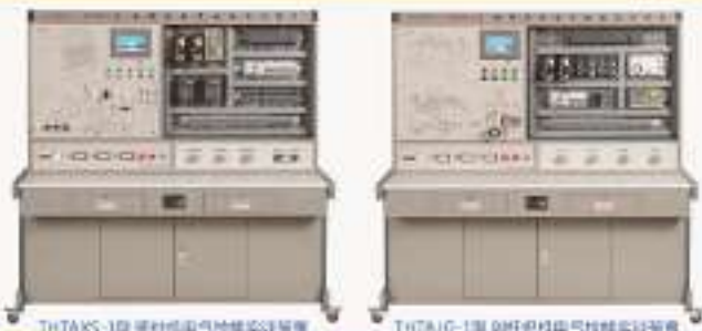
THTAXS-1型 粗纱机电气技能实训装置