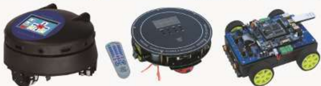
THIX-2型全向运动智能机器人