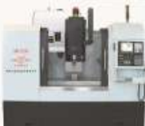
THWMSJZ-2A/2B型 网络型加工中心综合技能实训智能考核系统 (三轴, 垂直式刀架, 20把)