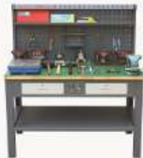
THMLCZ-2型 冲床模具装配与调试综合实训装置