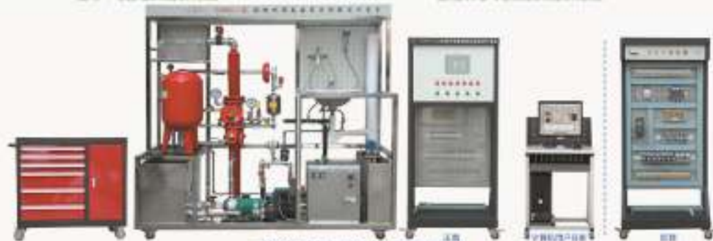
THPWSD-1型 给排水设备安装与控制实训装置