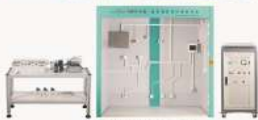
THWST-2A型 电气装置实训考核平台