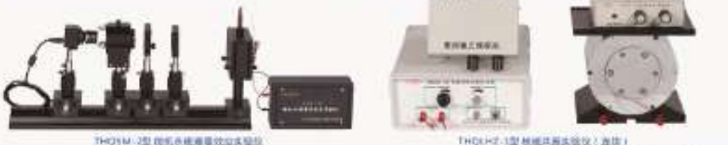
THQSM-2型 微机水银塞曼效应实验仪 THQLZ-1型 核磁共振实验仪(连续) THQBE-1型 波尔共振实验仪