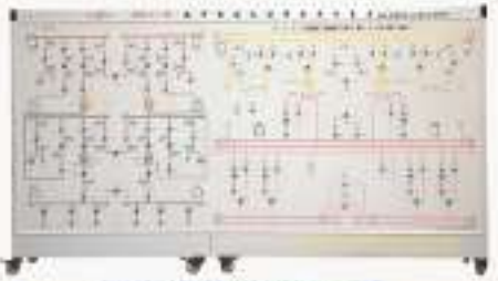
THRETS-1型 城市轨道交通供电实训装置