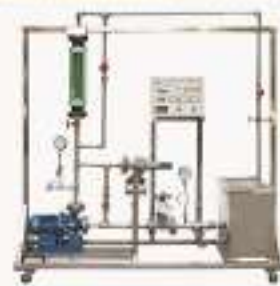
TH1H5D-1型 离心泵拆装实训装置