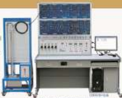
THACG-1型 煤矿传感器实验装置