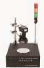
THVLR-1.1型 基于LabVIEW的虚拟仪器教学实验系统