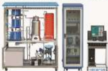
THFC5-1型 现场总线过程控制系统