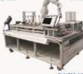
THMSRB-1/A型 工业机器人与智能装配系统应用实训平台