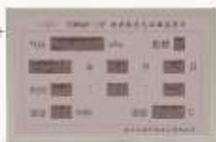
THWHQY-1型 精密数字气压湿度计