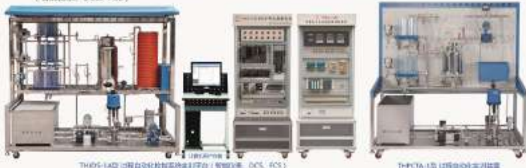
THUOS-1A型 过程自动化控制系统实训平台（智能仪表、DCS、PCS）