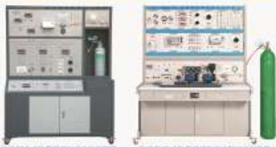
THFCDC-1型 氢燃料电池实训装置