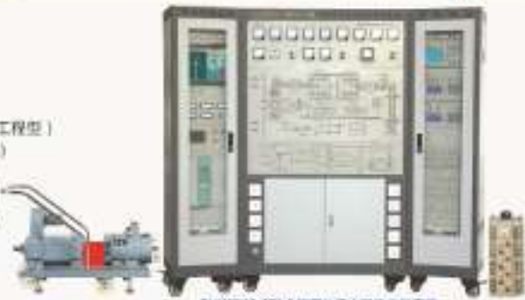
THWPYC-2型 永磁同步风力发电实训系统