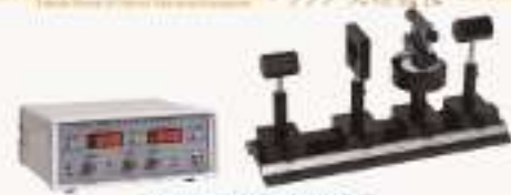
THQDG-1型 液晶电光效应实验仪