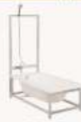
THPYG-1型 浴缸安装实训装置