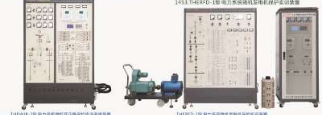
THPWJZ-1型 电力系统微机保护综合实训装置