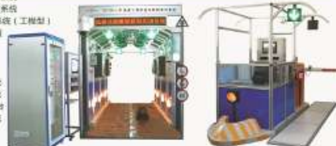
THUTSF-1型 高速公路收费站及监控实训系统