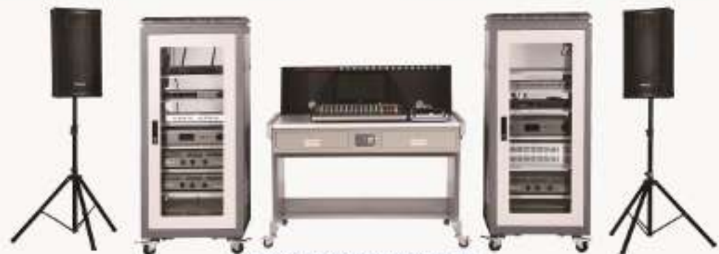
THAWTY-1型 音响设备维修与录音技术综合实训柜