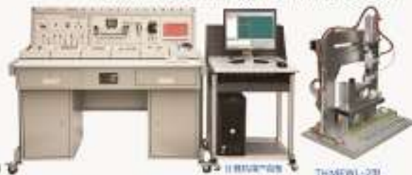
THMEMA-1型 单片机应用实训考核装置