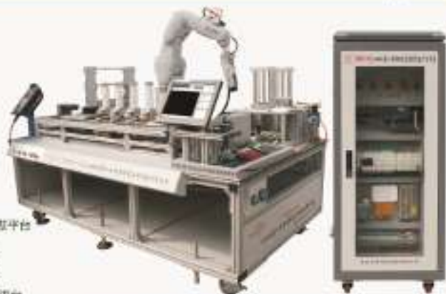
THMSR8-4A/4B型 工业机器人与智能视觉应用实验/开发平台