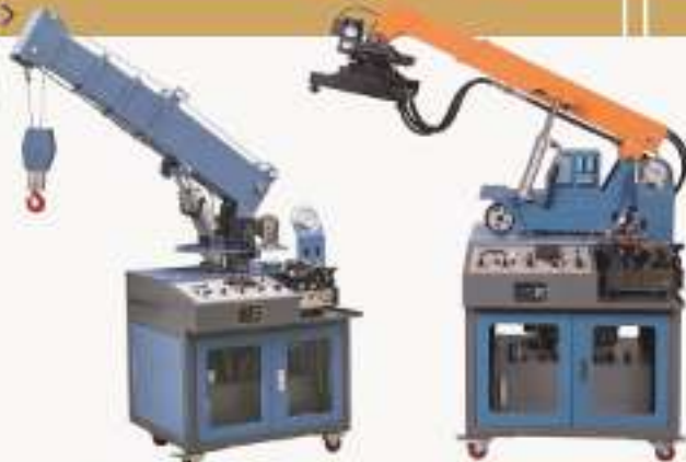
THHEQZ-1型 起重机械液压系统实训装置