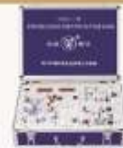
THZY-1型 放疗剂量计校准及曝光剂量保护电路实验箱