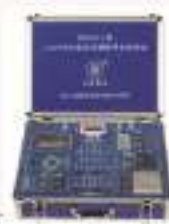
THVLR-1型 LabVIEW虚拟仪器教学实验系统(配USB数据采集卡)