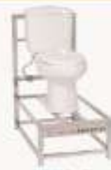
THPZBQ-1型 小便器安装实训装置