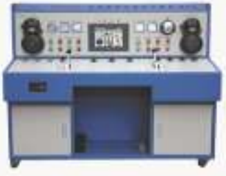
THM1ATS-1型矿井提升系统实训装置 (工程型)