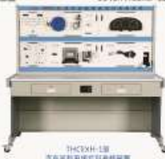
THCEXH-1型 汽车巡航系统实训考核装置