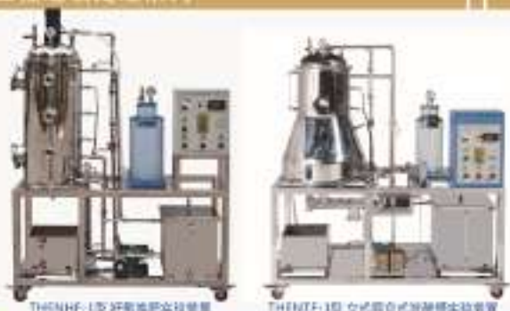
THENHF-1型 好氧发酵实验装置 THENTF-1型 立式筒仓式发酵实验装置