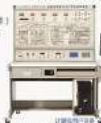
THRHBP-1型 变频空调电气实训考核装置