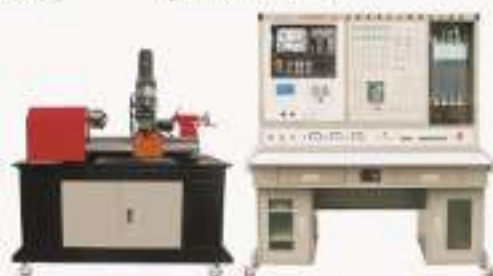
THWMBZ-1型 数控车床中心维修实训系统 (西门子) (配实物小机床)