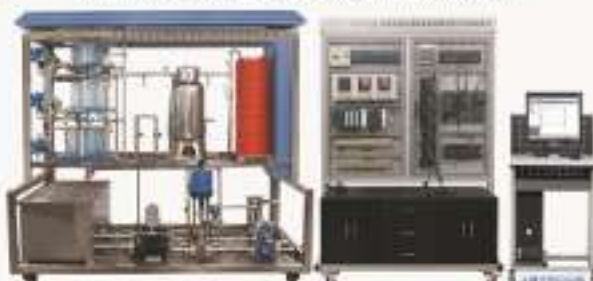
THUFC5-1型 过程综合自动化控制系统实验平台