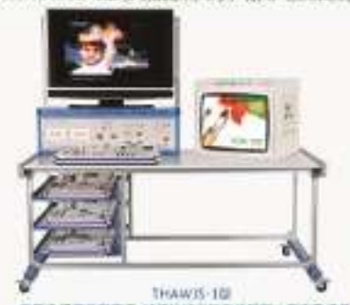
THAWIS-1型 家电维修产品维修工、维修技能实训考核装置 (家电维修类)