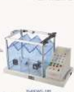
THPPFWY-1型 温度·压力给养实训模型（模拟量实物）