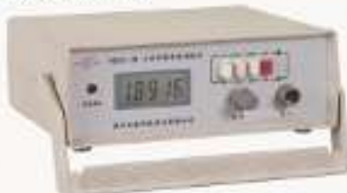
THQTS-1型 三位半数字特纳设计