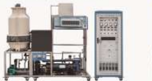
THRH8Z-2型 蓄冷空调制冷技术实训装置