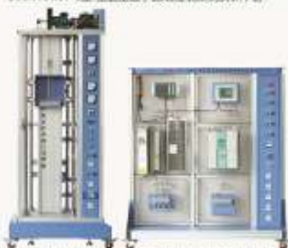
THAWK-1型 工业全数字交流调速控制系统综合实训平台