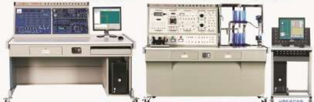
THGEI-2型电子工程系统设计开发实验平台

1737.THITI-2型 控制工程创新实验平台 1738.THIZD-2型 自动化系统应用及创新实验平台