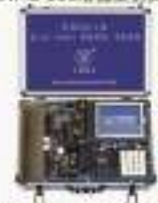
THUGA-1型 嵌入式(ARM10)高级实验/开发系统