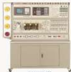
THWMDF-1型 数控机床电气控制与维修实训台 (发那科)