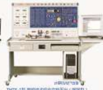
THZK-1型 测控技术综合实验平台(联网型)