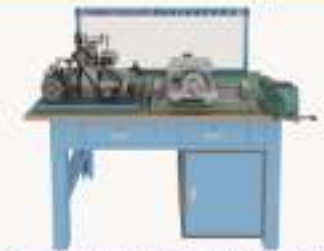
THLSZQ-1型 装配钳工技能实训平台 (单面工位)