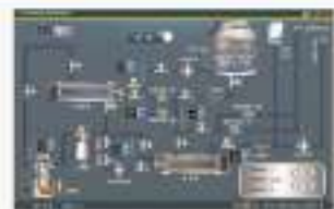
THS-BKT-1 中央空调系统的仿真软件