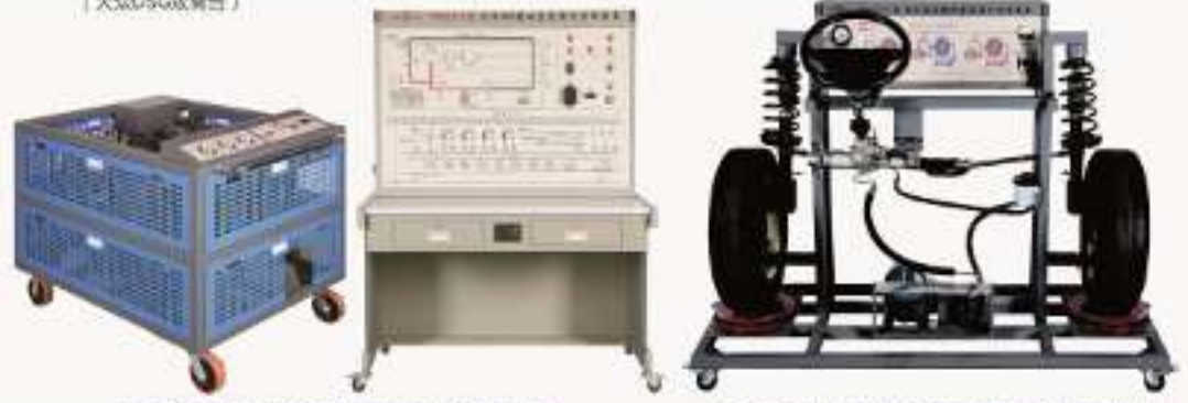
THCEZD-1型 汽车ABS制动系统实训考核装置 (大众帕萨特) THCEZZ-1型 汽车动力转向系统实训考核装置 (大众桑塔纳2000)