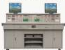
THETEZ-1型 电子综合应用实训装置