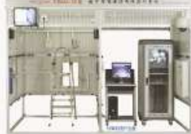
THBCAS-2A型 楼宇智能安防布线实训系统(工程型)