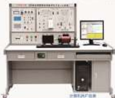
THRSM-A型 DSP电机控制综合实验开发平台(工程型)