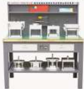
THMLTM-2型 模具结构设计与应用综合实训装置