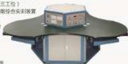
THETDA-2型 电子技术应用技能台（三工位）