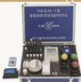
THPKJK-2型 智能家居系统开发实验平台