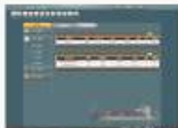
THS-LGW-1 国际物流综合协作系统软件