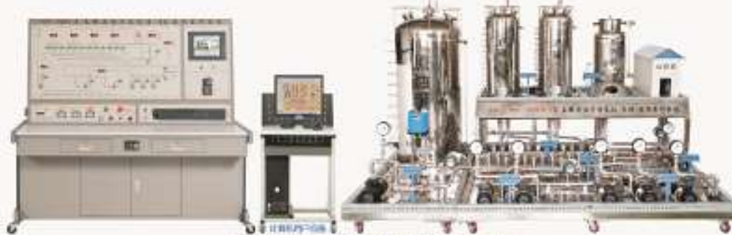
THOGYB-1型 长输原油管道泵站（首站）监控实训装置（工程型）