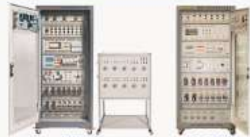
THPEM-2S型 机床PLC电气控制实训考核装置 (三菱) THPEO-1S型 机床PLC电气控制实训考核装置 (欧姆龙)