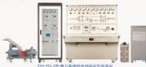
THLZD-1型 电力系统综合自动化实验装置