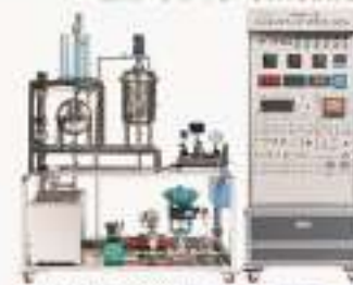
THAMHW-1型 化工仪表维修工实训考核装置(初中级)