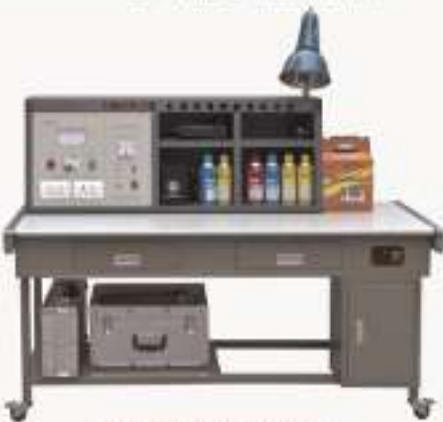
THHJTS-1型 美国探伤检测实训平台