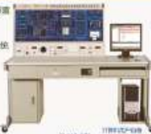
THVZ-1型 智能仪器及虚拟仪器综合实验装置