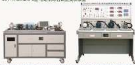
THMRAT-1型电机装配与运行检测实训考核装置 THMRJC-1型电机故障检测实训考核装置