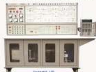
THKIP5-1型 IGBT变频调速电机变频调速实训考核装置