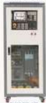
THWMD0-1型 数控机床电气控制与维修实训台 (西门子)