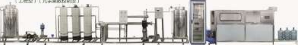
THFABL-1型 啤酒自动化生产线过程控制实训系统（工程型）