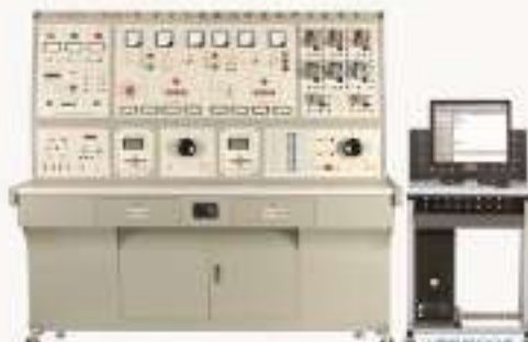
THLWX-1型 电力系统微机线路保护实验装置