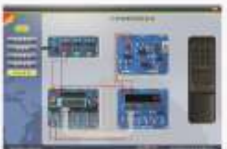
THS-EDA-1 电子产品搭建与调试仿真软件