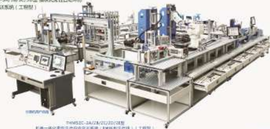
THMSZC-2A/2B/2C/2D/2E型 机电一体化柔性生产综合实训系统（8米环形生产线）（工程型）