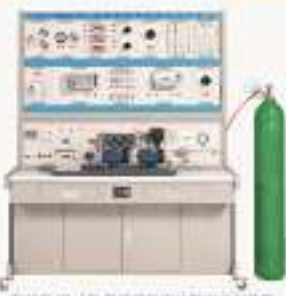
THFCND-1型 氢燃料电池发电实训装置