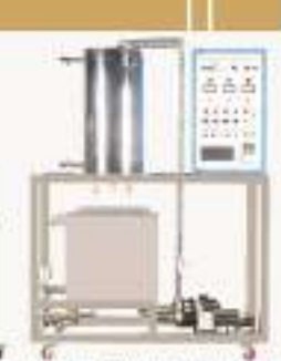
THAKL-1型 矿井水位自控控制实验装置