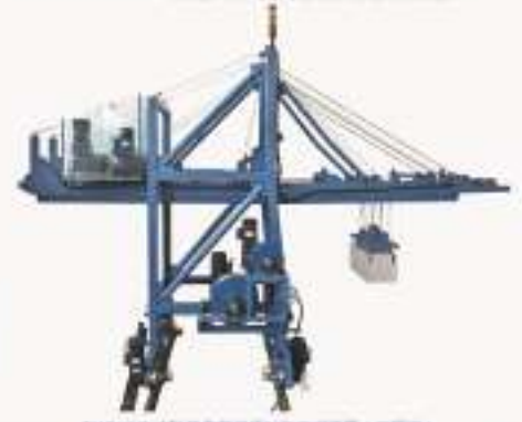
THGKAQ-2型 集装箱桥吊对象实训装置(工程型)