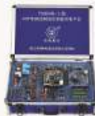
THRSM-1型 DSP电机控制综合实验开发平台