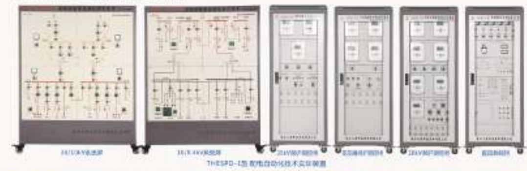
THESFZ-1型 发电厂综合自动化实训考核平台