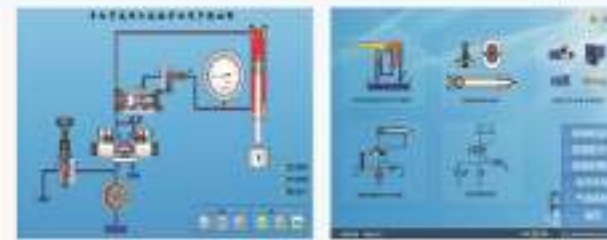
THS-PYC-1 液压传动仿真教学软件