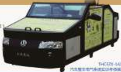
THCEZX-1A型 汽车整车实训考核系统 (大众帕萨特)