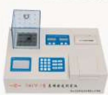
THAITP-2型 总磷快速测定仪