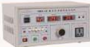
THMXR-1型 数字式泄漏电流测试仪