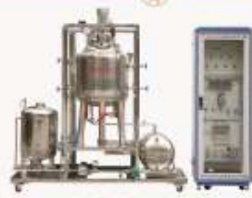
TH1HFY-1型 反相萃取实训装置(工程型)