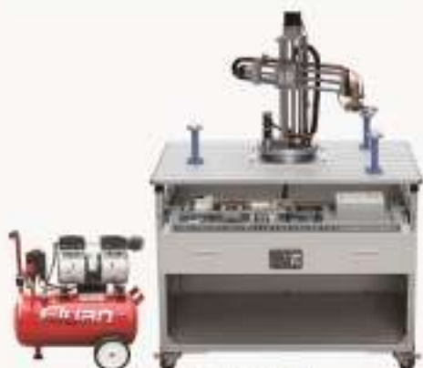
THWK-1型 机电一体化控制教学实验系统