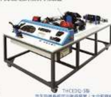
THCEQD-5型 汽车启动系统实训考核装置 (大众帕萨特)