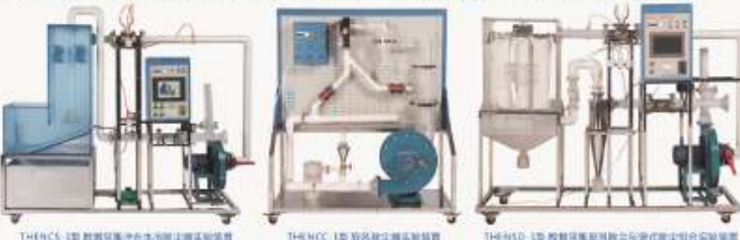
THENC5-1型 数据采集湿性水浴除尘实验装置 THENC-1型 湿性除尘实验装置 THEHD-1型 数据采集湿性湿性除尘净化综合实验装置