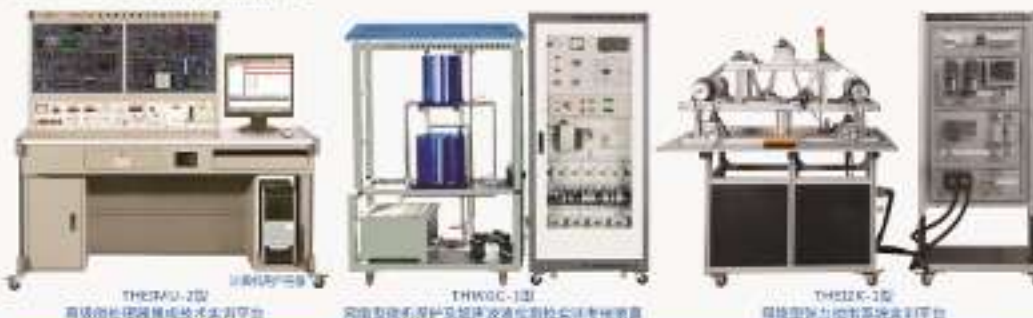
THFAE-1型 智能自动化电气实训装置