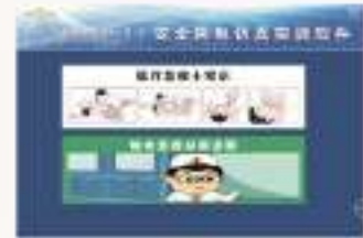
THS-EAQ-1 安全用电的仿真软件