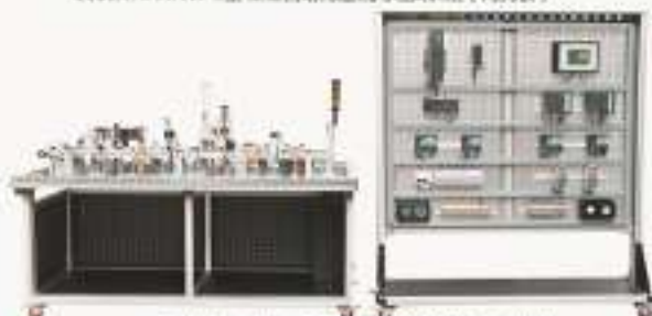
THANA-3A/3B/3C型 工业电气自动化及网络实训装置