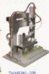
THMEWL-2型 物料搬运单片机控制实训装置