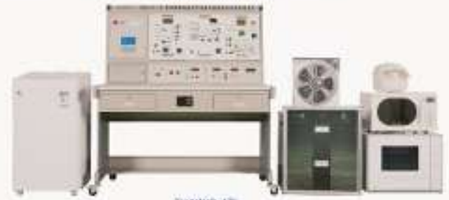
THAWJD-W-1型 多功能家用电子产品电气控制综合实训装置