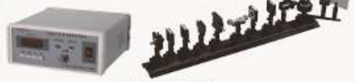
THQJA-1型空气折射率测量仪