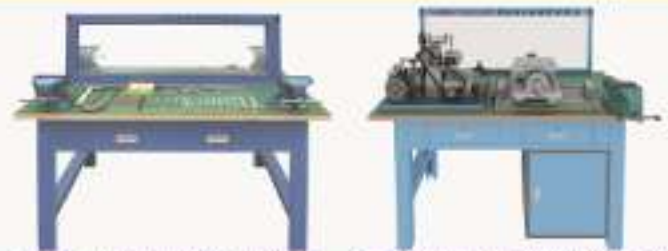
THLSQG-2型 钳工技能实训平台 (双面四工位)