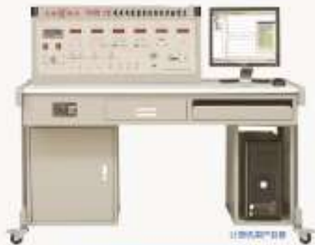
THSGD-2型光电传感器系统综合实验装置