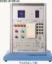
THFMJ-1型门禁控制系统实物教学模型