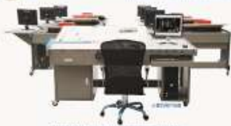
TH-ED1020型 经济型工程制图实训设备