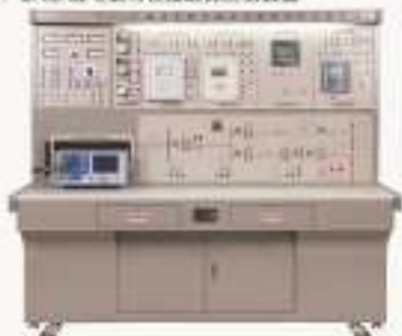
THKDZB-1型 电力自动化及继电保护实验装置