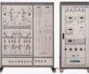
THRESS-1型 牵引供电系统实训装置