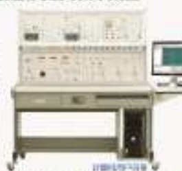
THRHZD-1型 变频空调电气实训考核装置