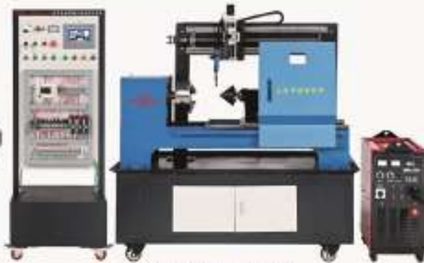
THHJZD-1型 虚拟自动焊接工作站实训系统