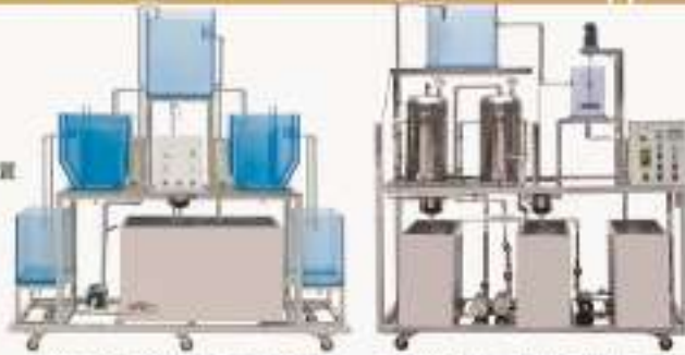
THENPW-1型 单池全絮凝过滤水PW-W 混凝分离实验装置 THENYS-1型 生物法回收有机废气SO 2 实验装置