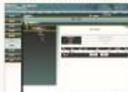
THS-LWM-1 物流仓储管理系统软件