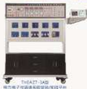
THEAZT-34B 电力电子与调速系统实验/开发平台