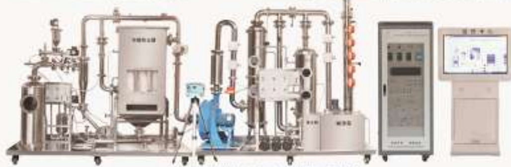
THEMDQ-1型 大气环境检测与治理技术综合实训平台