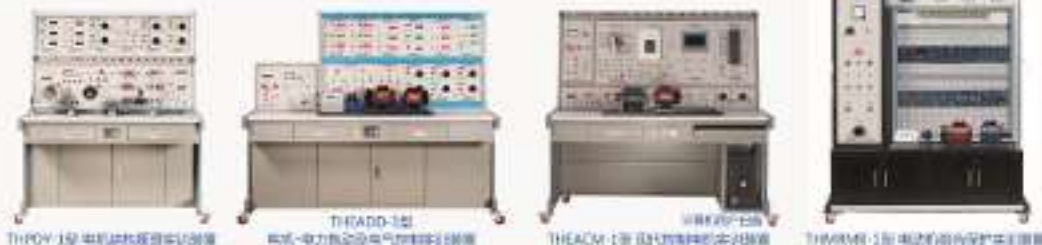
THPDY-1型电机结构原理实训装置 THEADD-1型电机+电力拖动及电气控制实训装置 THEACM-1型现代控制电机实训装置 THMRMB-1型电动机综合保护实训装置