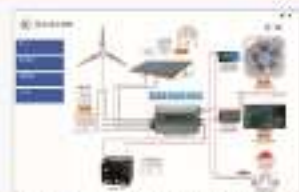
THS-XFG-1 光伏互补发电系统的仿真软件