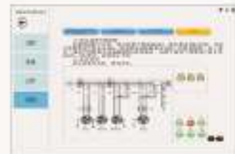
THS-EMV-1 维修电工综合仿真软件