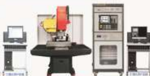
THWZK-2A/2B型 加工中心装调维修实训装置 (配实物立式加工中心)