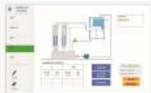
THS-HLL-1 流体力学实验仿真软件