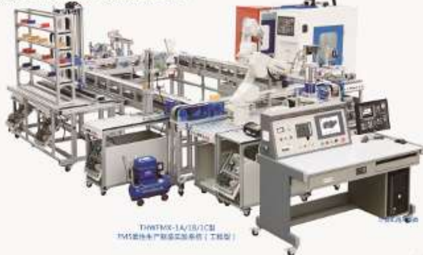
THWFMX-1A/1B/1C型 FMS柔性生产制造实验系统 (工程型)