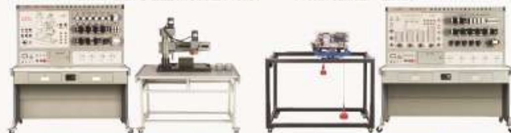
KH5-Z3040B型 摆臂钻床电气技能实训考核装置 (半实物) KH5-20/54型 桥式起重机电气技能实训考核装置 (半实物)