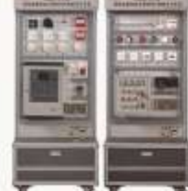
THBCAS-2-A型 消防报警联动及消防DOC控制实训系统