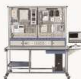
THBACK-1型 楼宇自控创新实训平台(视孔教学)