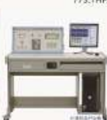
THPLXJ-1型 离心风机性能测试实验台