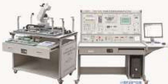
THPSF-5A/5B型可编程控制系统实验/开发平台