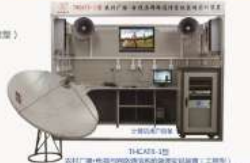
THCAJD-1型农用机电设备电气检修实训装置 THCAWS-1型多功能智能温室大棚综合实训系统