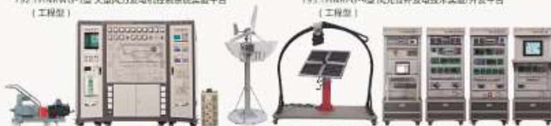
THNR5K-1型 双馈异步风力发电实验系统