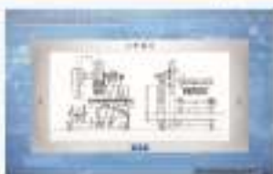
THS-JDT-1 电梯系统仿真软件