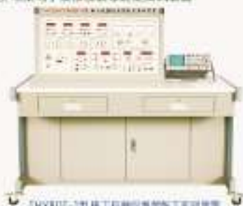
THYBDT-1型 电工仪器仪表装配工实训装置