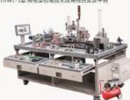
THJDAL-2A型 自动生产线拆装与调试实训装置