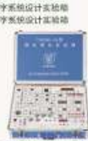
THDM-1A型数电综合实验箱