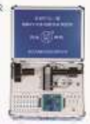
THP7CD-1型线阵CCD综合实验仪