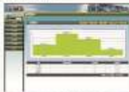
THS-LTM-1 物流运输管理系统软件