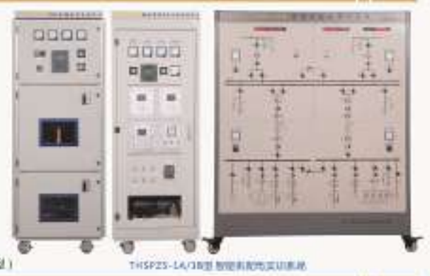
THSPZS-1A/1B型 智能供配电实训系统