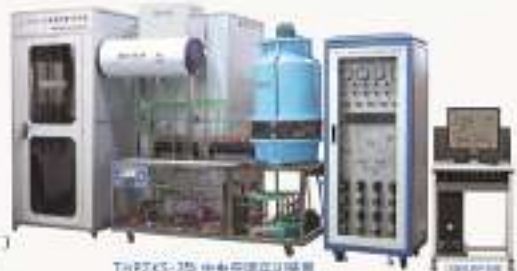
THPZKS-2型 中央空调实训装置