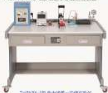
THPYXJ-1型 热力学第一定律实验仪