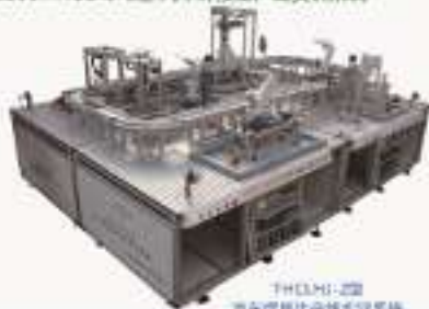
THCLUH-2型 汽车焊控生产线实训系统