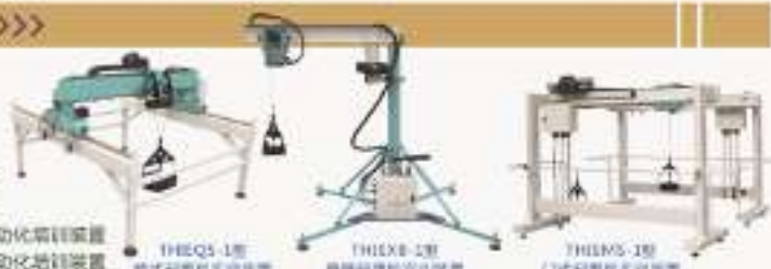
THIEQS-1型 桥式起重机实训装置