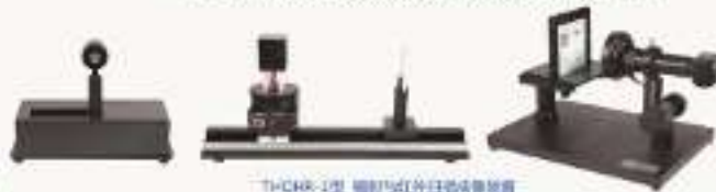
THQHR-1型 辐射与红外扫描成像装置