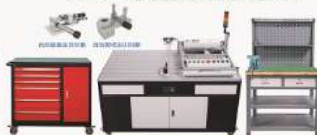
THMDZK-1型 多功能综合机械及自动化技能实训平台