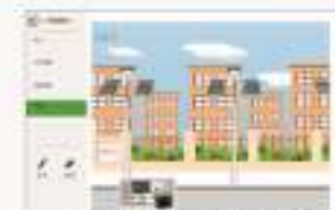
THS-XFD-1 光伏发电系统的仿真软件