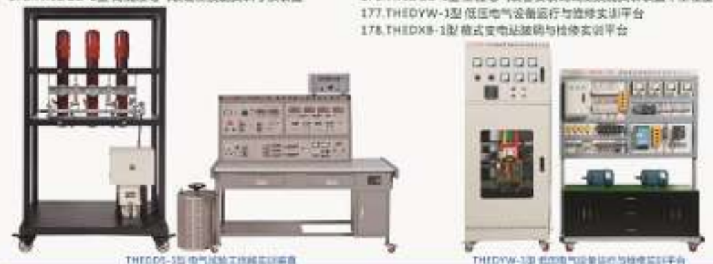
THEDDS-1型电气试验工技能实训装置 THEDDY-1型工程电气设备运行与维修实训平台