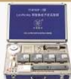
THPEP-1型 LonWorks网络集成开发实验箱