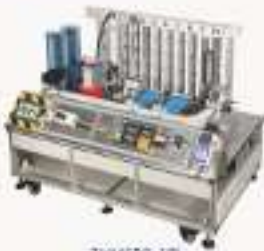
THMSRR-1型 工业机械手与PVC检测系统应用实训平台