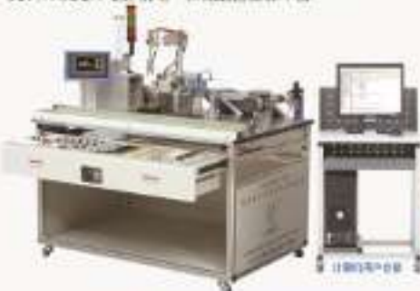
THJDME-1型 机电一体化实训考核装置