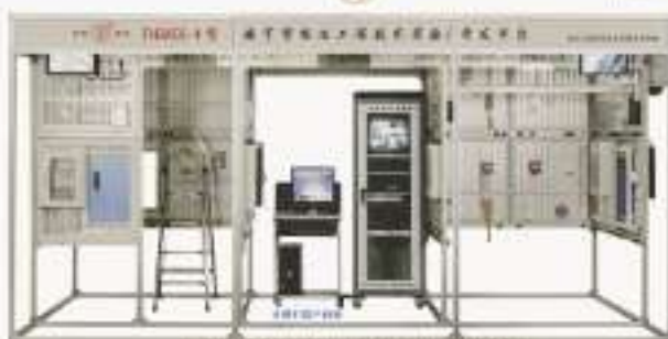
THBAES-4型 楼宇智能化工程技术实验/开发平台