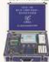
THUOC-1型 嵌入式(ARM7/ARM9)综合实验/开发系统(配仿真器)