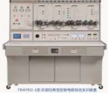
THAPKD-1型印刷机典型控制电路综合实训装置