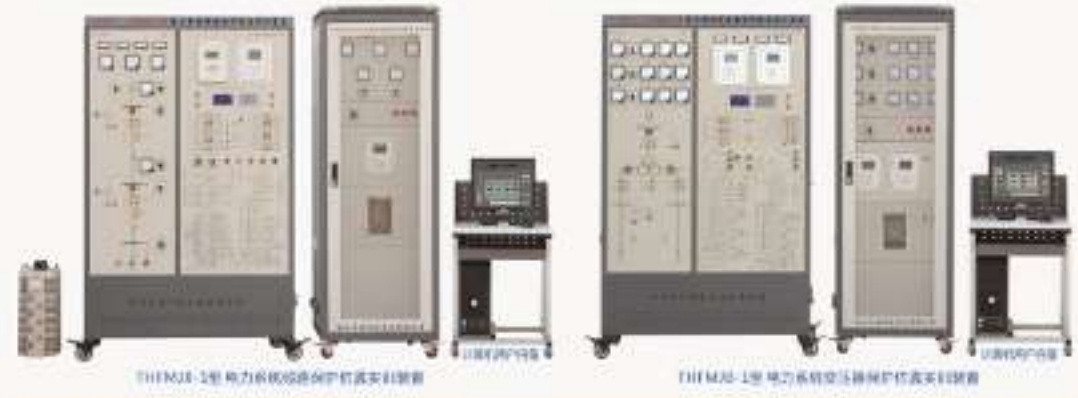
THFMD-1型 电力系统线路保护仿真实训装置