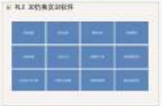
THS-TVR-1 PLC 3D的仿真软件