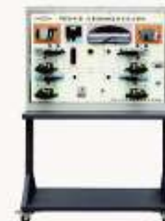
THCESEJ-8型 汽车CAN-BUS总线系统示教板