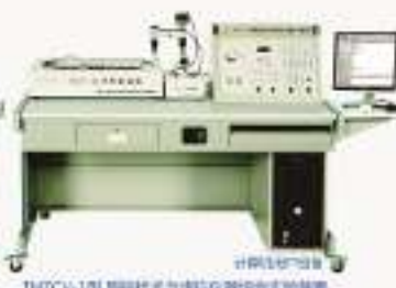
THZCV-1型 测控技术与虚拟仪器综合实验装置