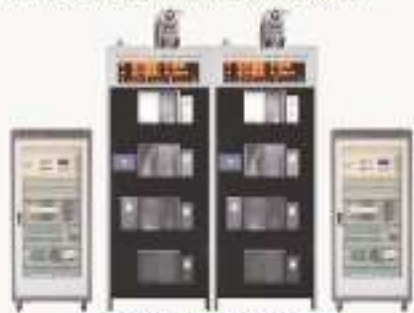
THJDDT-2型 电梯控制技术实训考核装置 (二次级数控制电路、总盘控制)