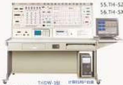
THDW-1型网络型电子学综合实验装置(局域网)