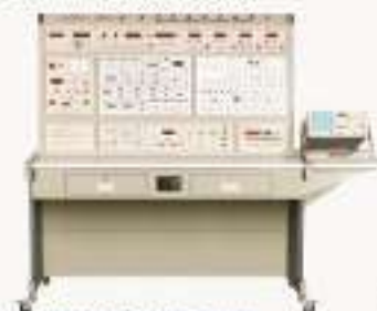
DZX-1型电子学综合实验装置