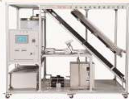
TH5TGR-1型 太阳能热水器实训装置