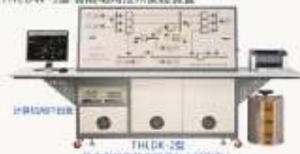
THL DK-2型 电力监控系统实验平台(网络型)