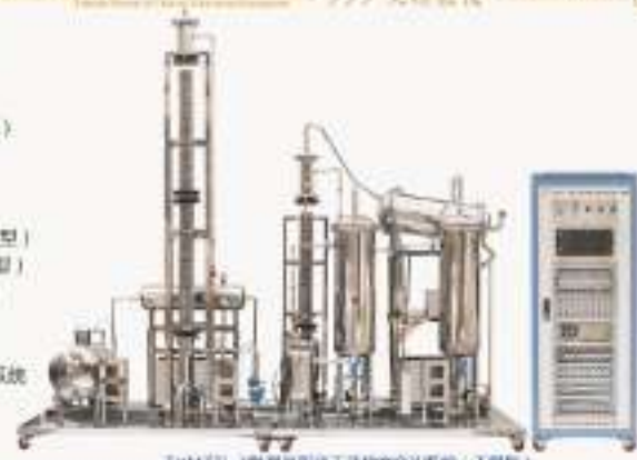
THM2ZL-1型煤炭炼焦工艺综合实训系统 (工程型)