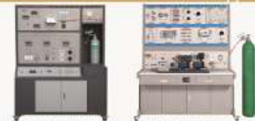
THRPFC-1型 氢氧燃料电池实验装置