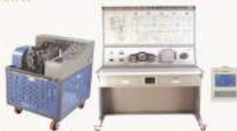
THCDS-1WS型 汽车自动变速器系统实训考核装置 (本田飞度自动挡)