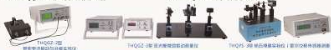
THQZ-2型 智能控制仪 THQZ-3型 激光测速实验仪 THQYS-3型 杨氏模量实验仪(霍尔传感器测位移)