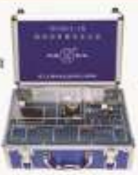
THSMX-1型 数码相机教学实训箱