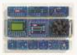
THETMK-1型 电子创新实训模块