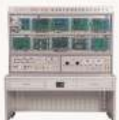
THEAZT-3C型 电力电子与调速系统设计/创新平台