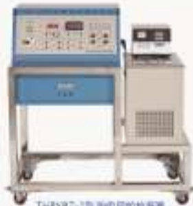
THPYRZ-1型 西姆顿吸收装置