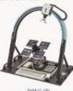
THPPFJZ-1型 太阳能基站光伏跟踪实训模型