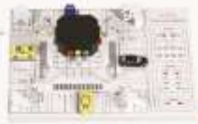
THFJT-1A型十字路口交通灯实物教学模型