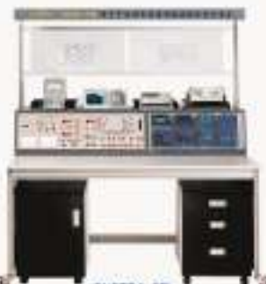
THETDA-3型 电子产品设计与装调技能综合实训装置