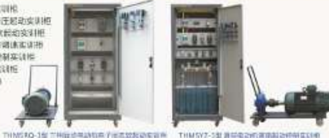
THMSRQ-1型三相异步电动机电子固态软启动实训柜 THMSYR-1型三相异步电动机变频软启动实训柜