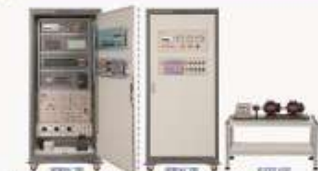
THPKW-3型 高压维修电工实训考核装置 (与PLC进行联动实训)