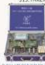
THRU-1型 DSP/ARM嵌入式综合实验/开发系统