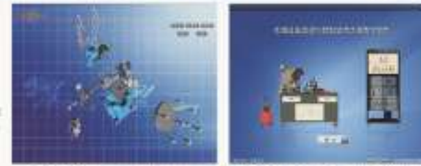
THS-MJS-1 机械制图仿真教学软件