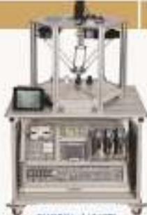
THRBB1-1/2/3型 多自由度并联机器人培训系统