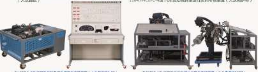
THCEDK-10型 汽车发动机电控系统实训考核装置 (大众帕萨特) THCEFC-1型 汽车发动机拆装运行实训考核装置 (大众桑塔纳2000)