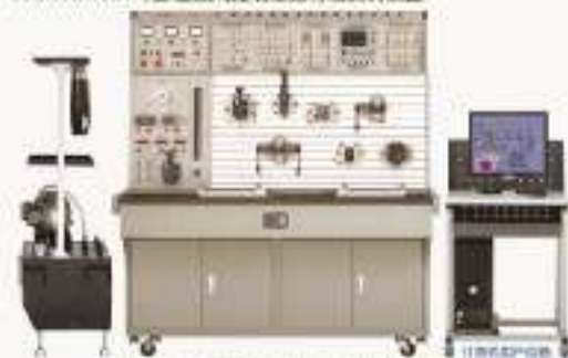
THHPY-2型 微机控制液压传动综合实训装置