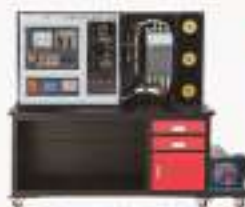
THWMD5-1T/1G型 数控机床装调维修实训装置 (西门子)