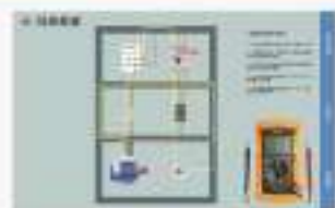
THS-ADK-1 煤矿电气仿真软件