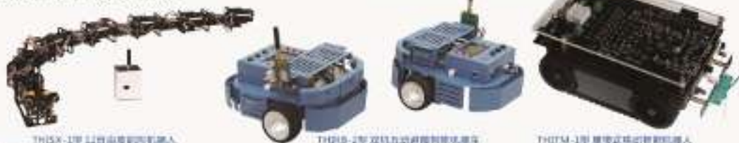
THISX-1型12自由度仿生机器人

1704.THIPF-2型 双头消防灭火智能机器人 1705.THIFB-1型 足球智能机器人 1706.THIFB-2型 盲球足球智能机器人 1707.THIFB-3型 六轮足球智能机器人 1708.THIPM-1型 双轮行走智能机器人 1709.THIPH-1型 平衡智能机器人 1710.THWG-1型 模轮智能仿生机器人 1711.THIPQ-1型 爬墙智能机器人 1712.THIE-1型 混合液料机器人 1713.THIRA-1型 基于ARM智能移动机器人(嵌入式探月车) 1714.THIRA-2型 基于ARM智能越野机器人(嵌入式探月车) 1715.THIB-1型 基于ARM智能实验机器人 1716.THIRE-1型 机器人工程创新套件 1717.THIFB-3型 五自由度工业机器人(机械臂) 1718.THESR-1型 模块化六自由度工业机器人 1719.THIPB-1型 自动焊接工业机器人