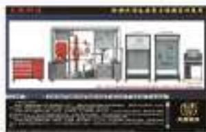
THS-BJS-1 建筑给排水系统的仿真软件