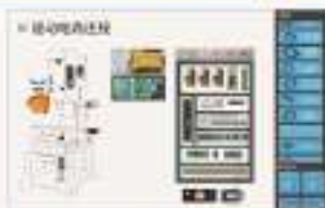
THS-WSH-1 加工中心维修仿真软件