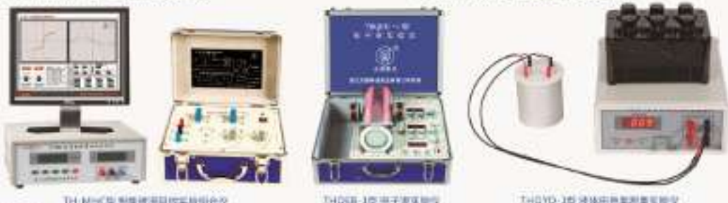
TH-MHC型 智能磁滞回线实验综合仪 THQEB-1型 电子束实验仪 THQYD-1型 液体电导率测量实验仪