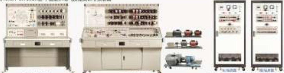
KH-X62W型 万能铣床电气技能实训考核装置 KH-P8A-A型 龙门刨床电气技能实训考核装置 (扩大机座、三套机组) THPJC-2型 机床电气控制实训考核装置 (柜式双面、四合一型、两种机床)